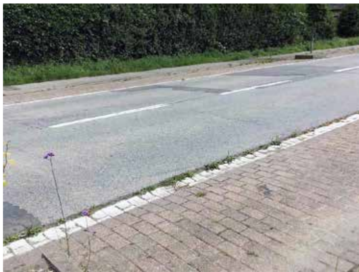
▲ Het wegdek van de Spiegellaan is dringend aan vernieuwing toe.

N-VA Merchtem zal niet nalaten om dit keer op keer aan te halen tijdens de komende gemeenteraden.