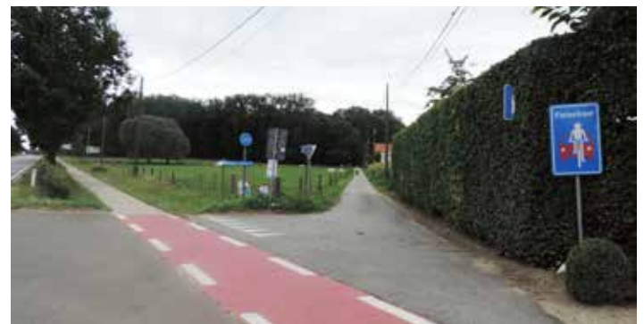
▲ De fietsstraat tussen de Wolvertemsesteenweg en de Kleistraat.

Tijdens de voorbije bestuursperiode werd er een werkgroep opgericht die verschillende knelpunten voor fietsers en voetgangers in kaart moest brengen. De knelpunten zijn bekend en met het eindrapport van deze werkgroep moet de huidige bestuursploeg aan de slag. De N-VA houdt de vinger aan de