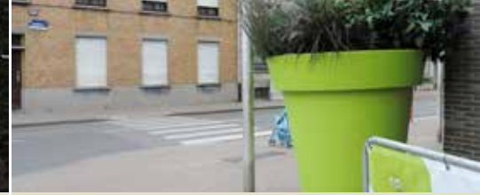
Bloempotten of verkeersveiligheid? (p. 3)