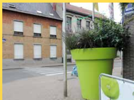
▲ De gigantische bloempot aan het gemeentehuis belemmert het zicht op het zebrapad.

Naast de gevolgen voor de veiligheid is er ook de hoge kostprijs. De zes bloempotten in het centrum kostten samen 5 000 euro. En daar komt nog eens zoveel bij, want ook in de deelgemeenten wil het schepencollege dergelijke bloempotten plaatsen.