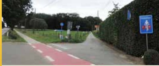
Uw straat een fietsstraat? (p. 2)